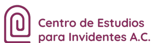
Centro de Estudios para Invidentes