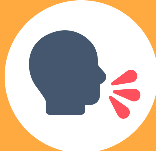
TOS / ESTORNUDOS