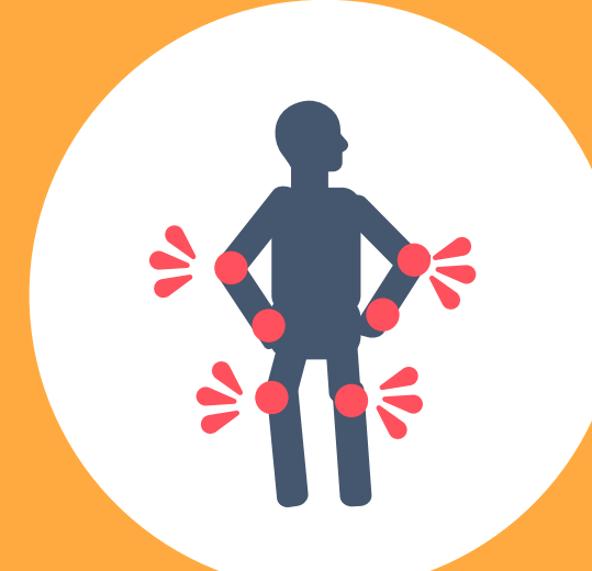
DOLOR MUSCULAR O EN ARTICULACIONES

▶ Debes de acudir a recibir atención médica si presentas algún síntoma y eres: